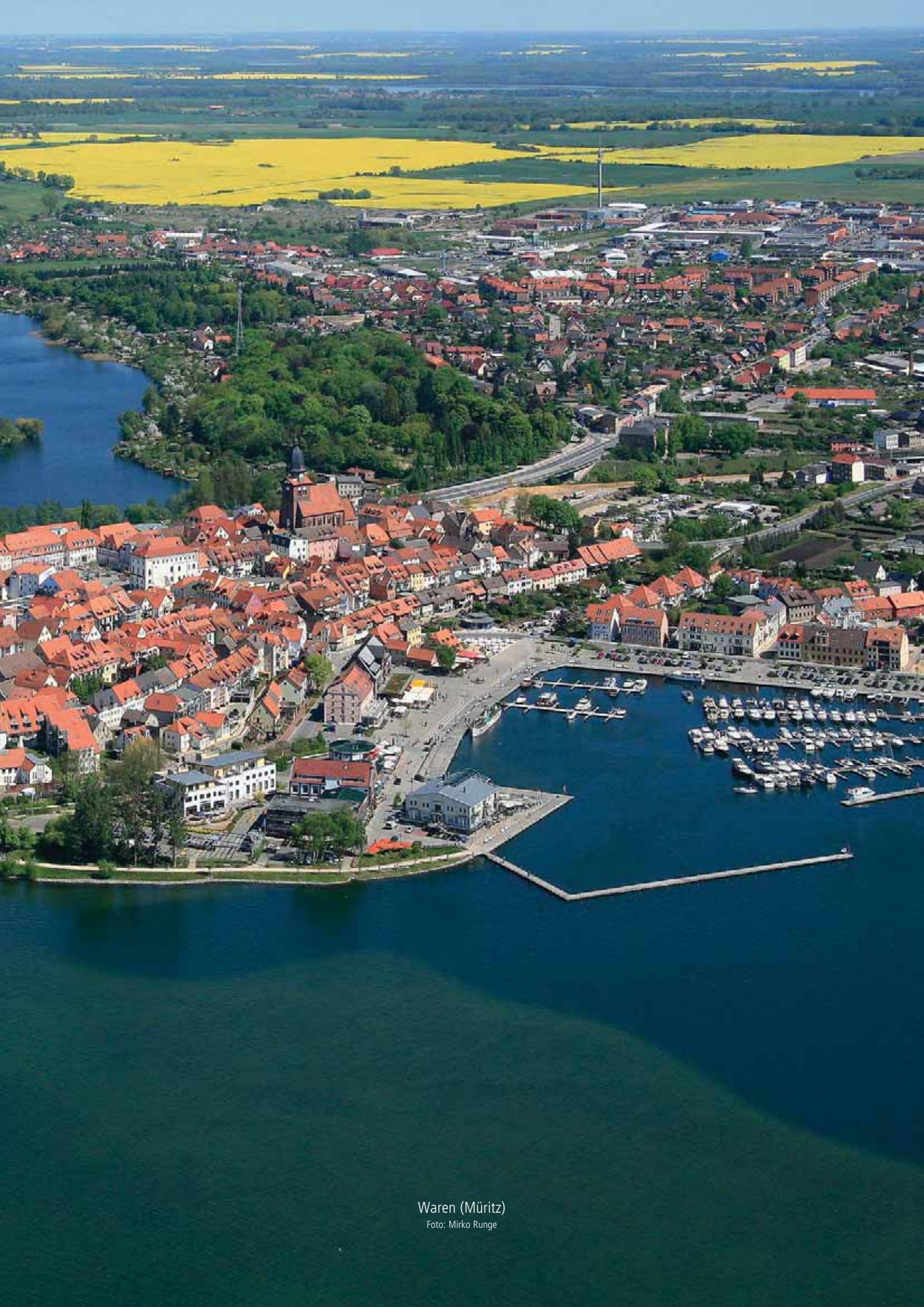
Waren (Müritz)